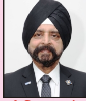
डिस्ट्रिक्ट गव्हर्नर रो. राजिंदरसिंग खुराना